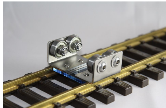
Rollenprüfstand einzeln ohne LED 01-01-00